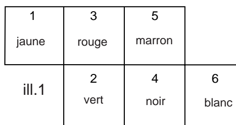
connecteur male noir

Remontez le connecteur dans le connecteur préparé.